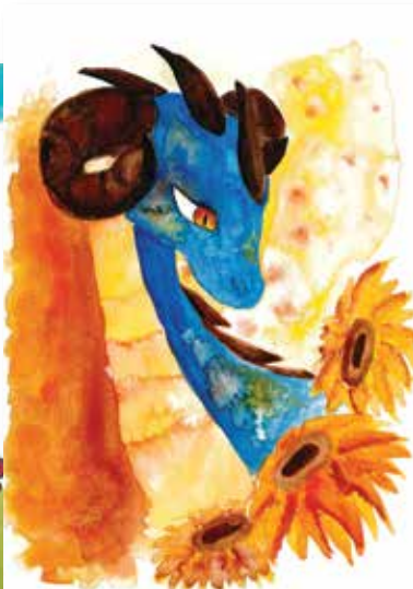
Slunečno Aneta, 14 let