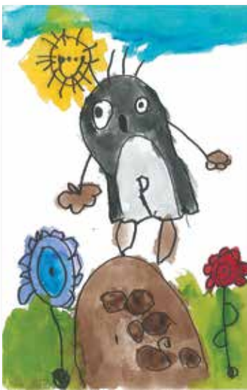
Krteček a kytičky, Klárka, 5 let

Napsali žáci z 3. A. základní školy a poslali nádherné obrázky a vlastní pohádkové knížky.