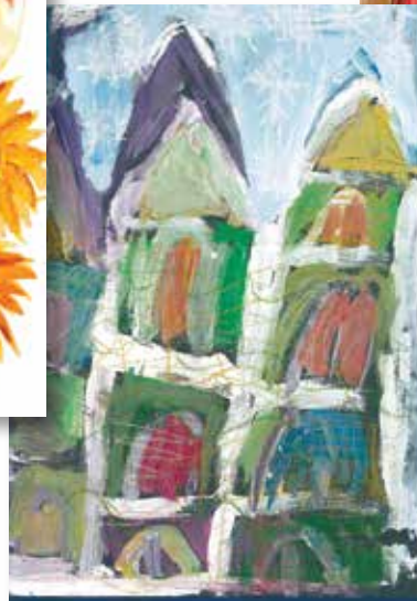
Zámek Zimní královny Lucinka, 6 let