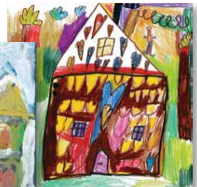
Perníková Chaloupka Patrik, 5 let